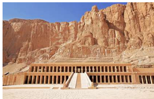
Trekking por el camino de los obreros hasta el Valle de los Reyes