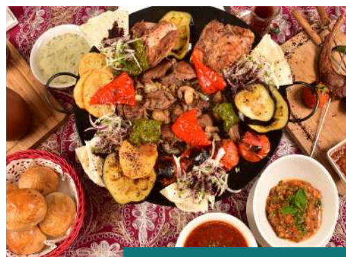
Almuerzo especial, conoce las tradiciones de Dubai