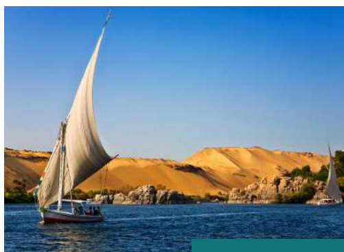
Paseo en faluca por el Nilo