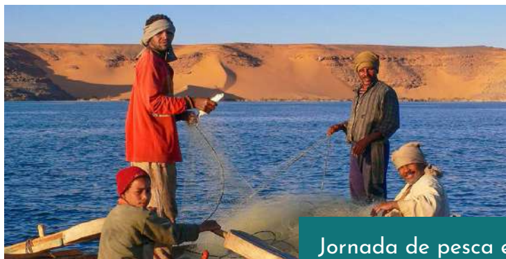
Jornada de pesca en el lago Qarun y Actividad Agraria con Campesinos en el Oasis de Fayum