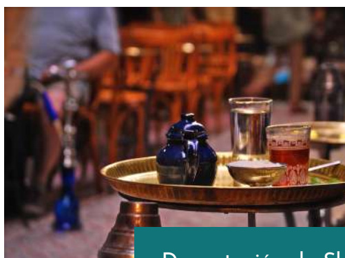
Degustación de Shisha en café público