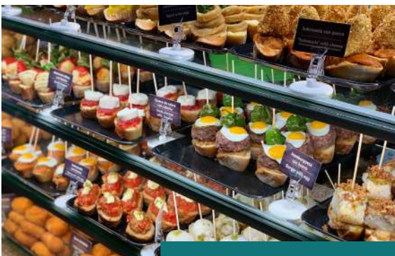
Tour de tapas por el mercado de la Boquería