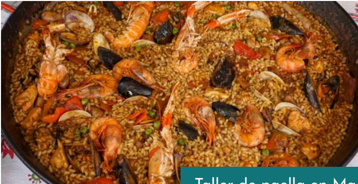
Taller de paella en Madrid o Cena de tapas.