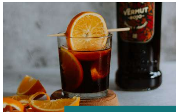
Cata de Vermuth en Madrid bohemio