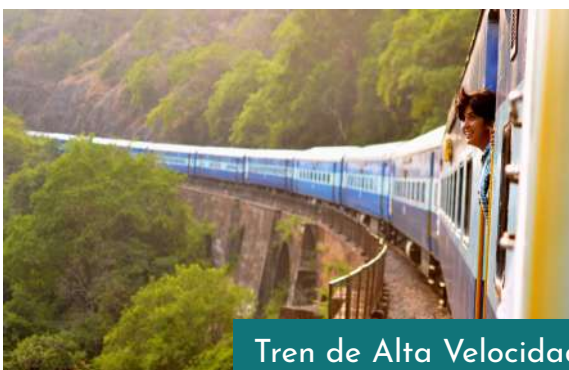
Tren de Alta Velocidad París y Niza