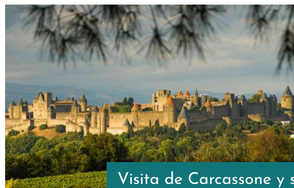
Visita de Carcassonne y su imponente Castillo