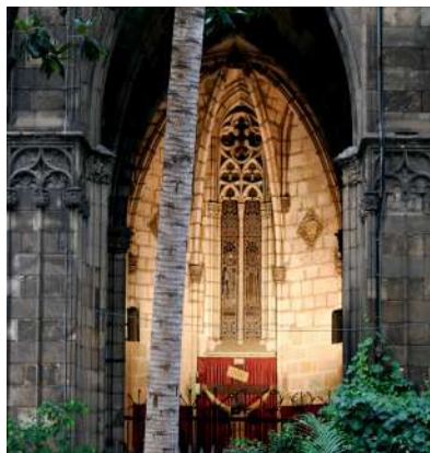
Walking tour gourmet por el barrio gótico