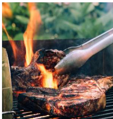
Cena en un asador vasco