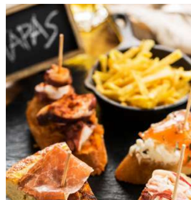
Ruta de tapas y vinos en Lugo