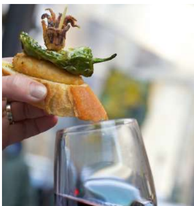
Cena pintxo pote en San Sebastián