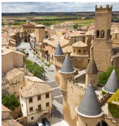
Visita guiada y entrada al Castillo de Olite