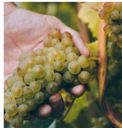
Visita Bodega zona Zarautz con degustación de Txakoli