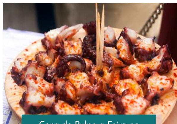
Cena de Pulpo a Feira en Santiago