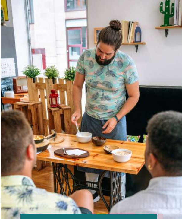
Clase de cocina en taberna típica en Mykonos