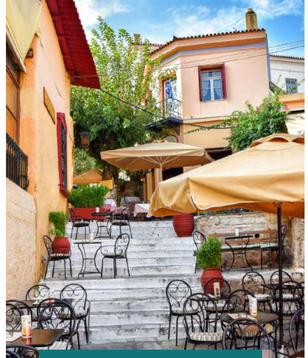
Tour de Tapas por el barrio de Plaka