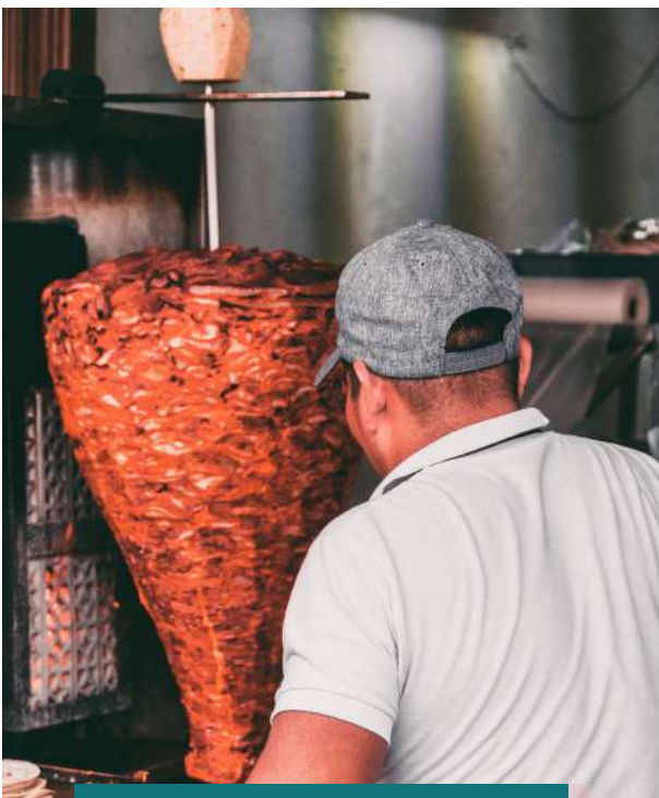
Degustación de doner kebab y helado típico turco